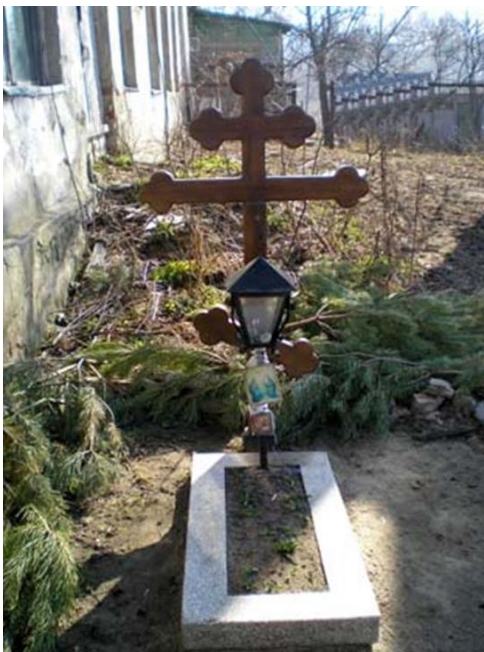
Рис. 10 Остатки храма Живоначальной Троицы