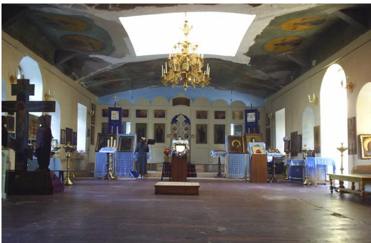
Рис. 20 Успенская церковь