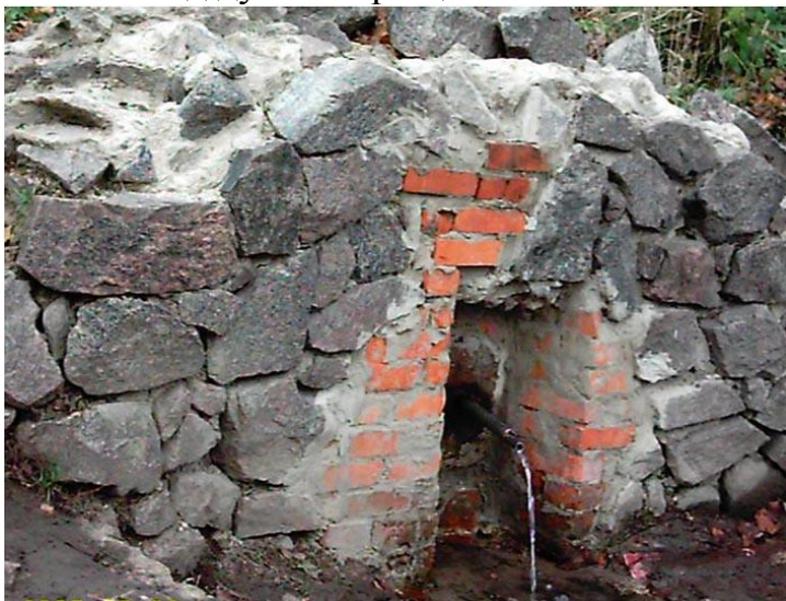
Рис. 25 Капитный источник (2007 г.)