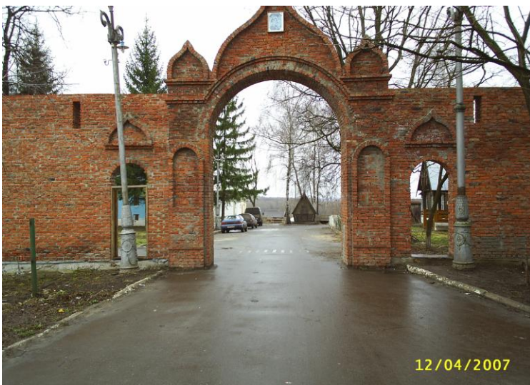
Рис. 17 Восстановление южных ворот монастыря, 2007 г.