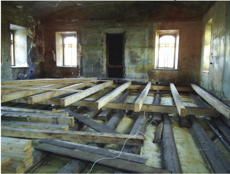
Рис. 19 Алтарь Успенской церкви после пожара 2006 г.