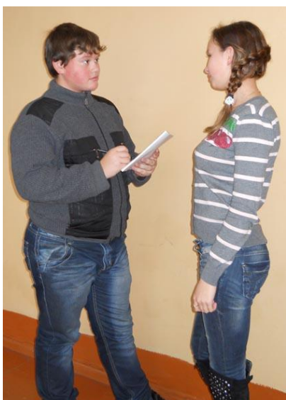
Рис. 2 Анкетирование учеников МОУ СОШ № 2 об истории церквей