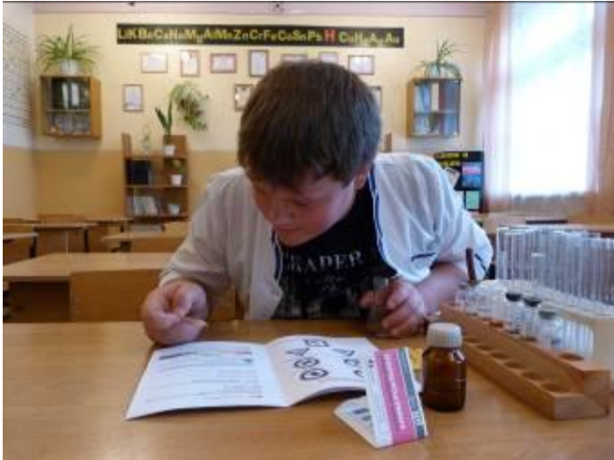
Рис. 27 Определение pH воды с помощью индикаторной бумаги