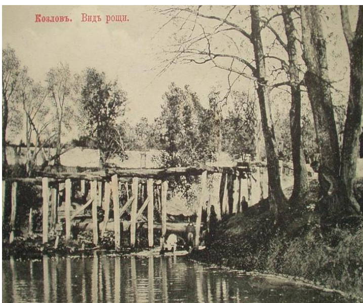
Рис. 24 Вид дубовой рощи вблизи источника, Козлов XIX век.