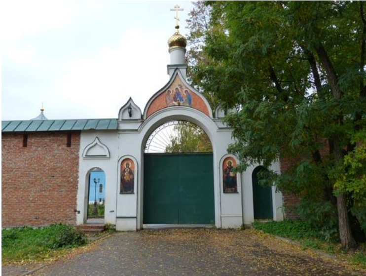
Рис. 18 Восстановленные южные ворота монастыря (2011 г.)