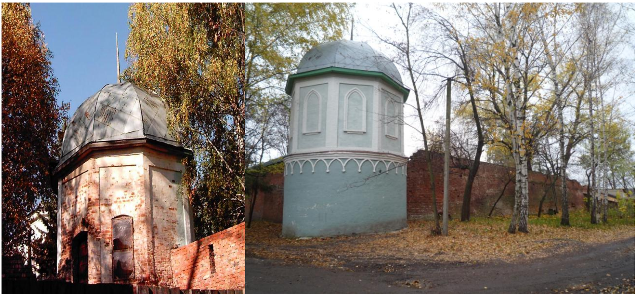
Рис. 15 Угловая башня, 2006 г. Рис. 16 Угловая башня, 2011 г.