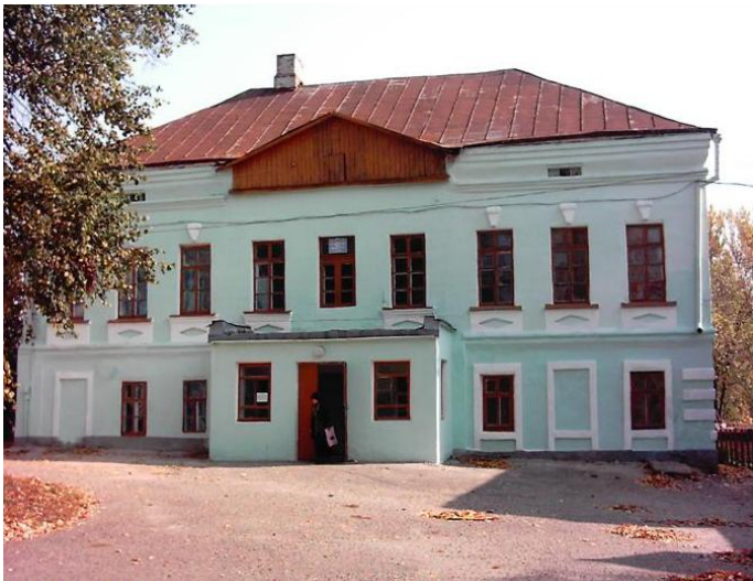
Рис. 7 Здание архиерейского дома