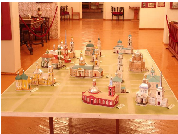
Рис. 1 Макеты церквей, расположенных в Козлове до 1918 года (материал краеведческого музея г. Мичуринска)