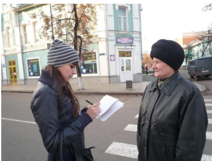
Рис. 3 Анкетирование горожан об истории церквей