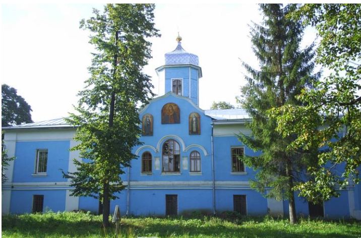
Рис. 11 Успенская церковь Троицкого монастыря