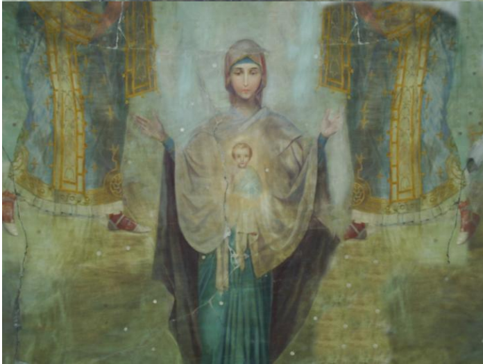
Рис. 13 Фрески Успенской церкви