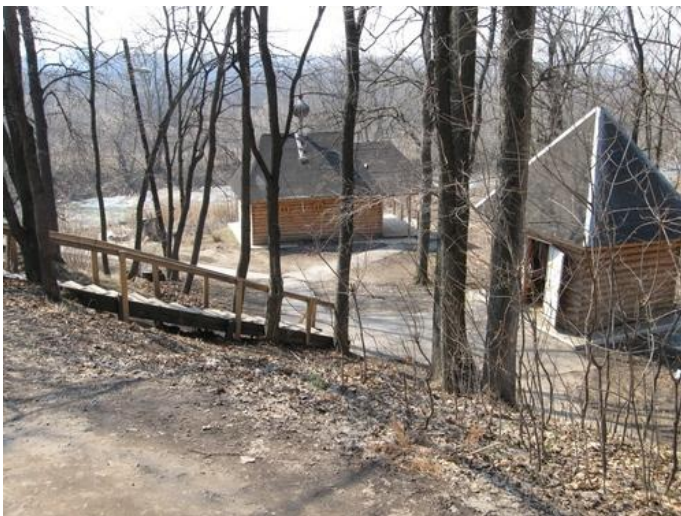
Рис. 23 Святой источник (монастырская купель)