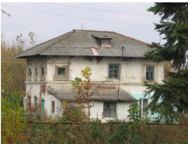
Рис. 8 Здание гостиницы для богомольцев