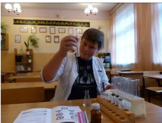
Рис. 26 Проведение химического эксперимента в химической лаборатории МОУ СОШ № 2 г. Мичуринска Тамбовской области (10.11.2009 г.)