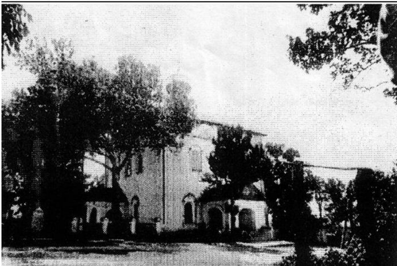
Рис. 9 Храм Живоначальной Троицы XIX век