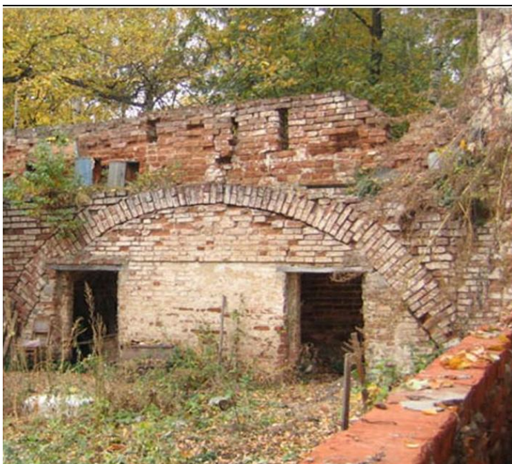
Рис. 5 Остатки монастырской стены XVIII века