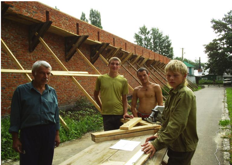
Рис. 14 Восстановление северной части монастырской стены