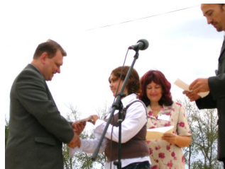
На снимке: Ане вручается награда.

детелями конкурса букетов среди школ и детских садов города. Морю красок, фантазии, творчества и находчивости детей подвела итоги представительная комиссия, которая была даже в