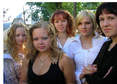
1 сентября 2006 г.: «В этом году—мы тоже выпускники!» На снимке: 9 "Б" на торжественной линейке.

Первое сентября нового учебного года было для меня очень важным. Не потому, что я принимал участие в торжественной части нашей традиционной линейки, а потому, что этот школьный праздник, День Знаний, был у меня последний раз в жизни. Больше я никогда не приду в школу первого сентября в качестве ученика и это очень грустно. Но первое сентября 2006 года я буду помнить долго, и торжественную линейку, и поход всего класса на природу в этот день. Жаль, конечно, что время летит так быстро и его не остановить. И, кто знает, может когда-нибудь на первое сентября я приведу в мою РОДНУЮ ШКОЛУ своих детей.