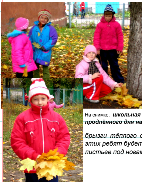
На снимке: школьная группа продлённого дня на прогулке.

Казалось, совсем недавно сентябрьское тёплое солнце ласкало деревья, а они, перешептываясь зелёными листьями, приветливо и лениво качались на лёгком ветерке. Казалось, что