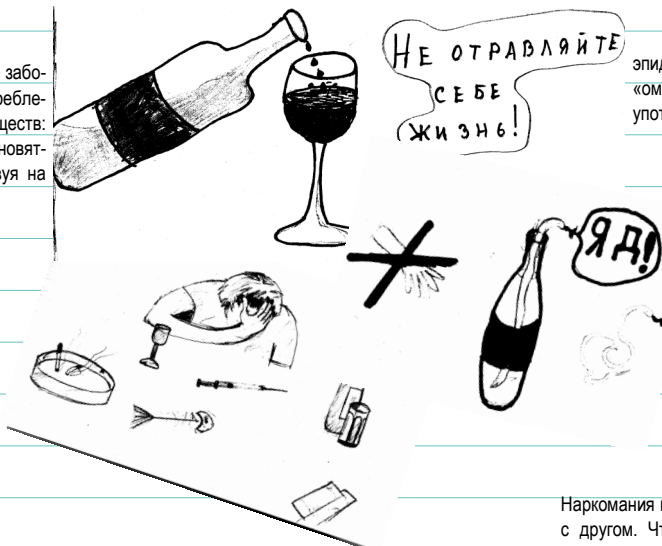
Рисунки выполнены Кузнецовой Н., (7Б, 2005г., кл. рук. Анциферова Т.Н.)

К сожалению, это не строки из фантастического романа, а суровая действительность. Беда рядом с нами и ждёт всё новых и новых жертв. А жертвы не заставляют себя долго ждать! К началу XXI века злоупотребление алкоголем и наркотиками приняло характер